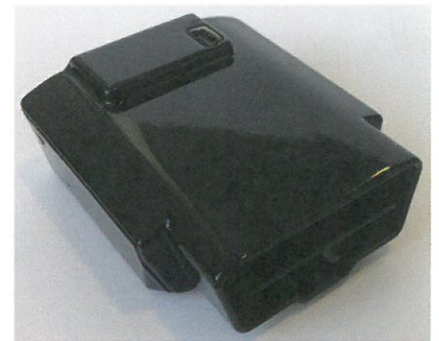
Mi30 OBD Dongle

Dankzij het gebruik van state of the art technologie is de Mi30 zeer eenvoudig te gebruiken en maakt het zeer vlot verbinding. Hierdoor bent u verzekerd van een goede en accurate Ritregistratie.